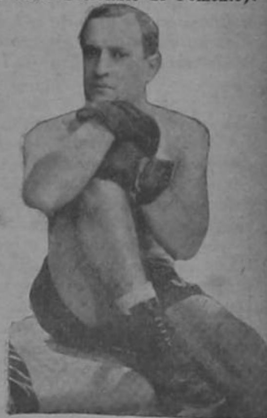
Dr. Calderón Guardia.—¡Y yo que creía que era un dormido...!

El Campeón se pone avispa (Los trabajos que lleve a cabo el gobierno con el millón de dólares, de hecho benefician la candidatura del señor Secretario de Fomento).